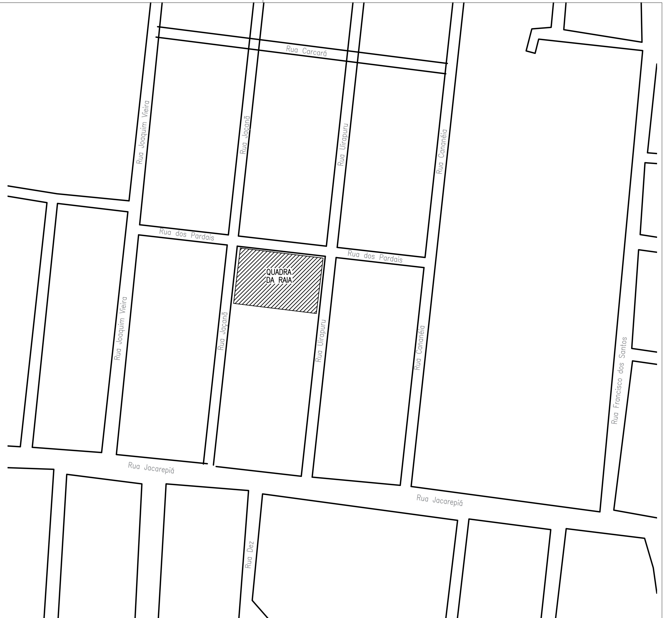
PLANTA DE LOCALIZAÇÃO ESCALA 1:1000