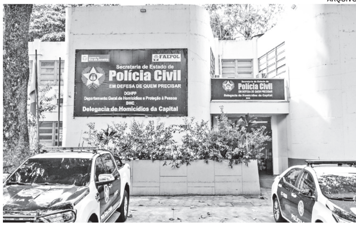
Caso é investigado pela Delegacia de Homicídios da Capital (DHC)

De acordo com a Polícia Militar, equipes do 16º BPM